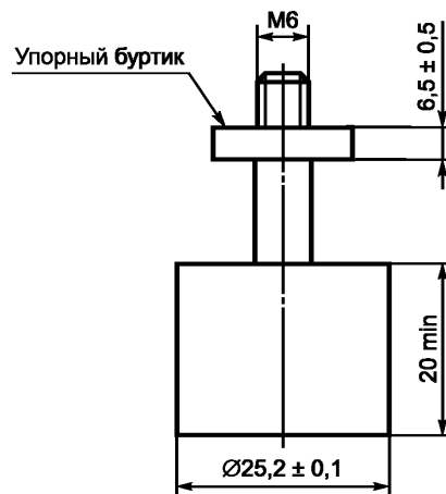
Рисунок 3 — Испытательный штамп площадью основания 500 мм 2